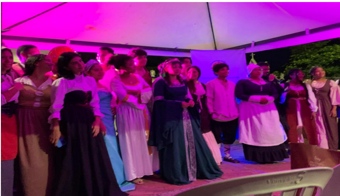
V Jornada de Tradición Oral como Patrimonio: Cuentos e historias de miedo y terror en Santa Marta.