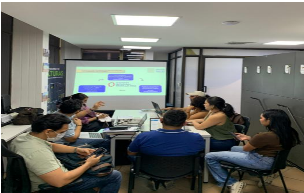
Reunión de planeación del proyecto Memorias que dialogan, una estrategia territorial de apropiación social del Fondo Documental de la Comisión de la Verdad.