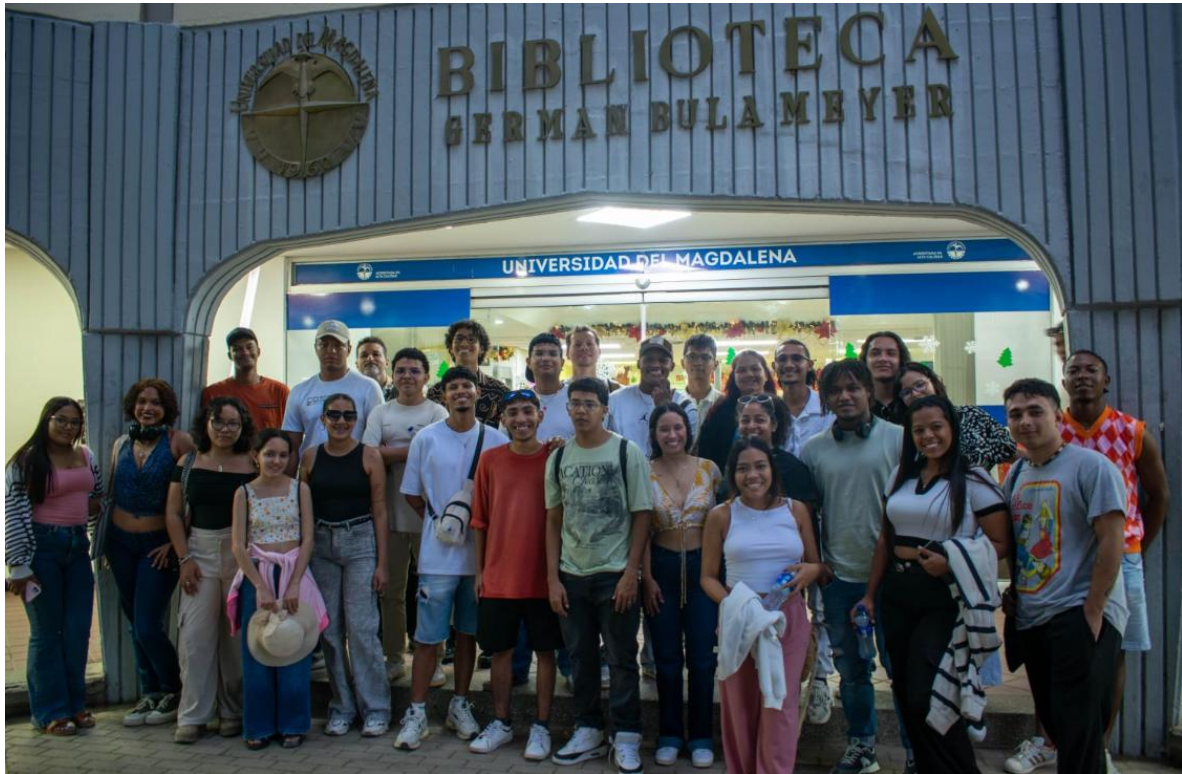
Visita de estudiantes de Historia de la Universidad de Cartagena al Laboratorio de Historia y Patrimonio.