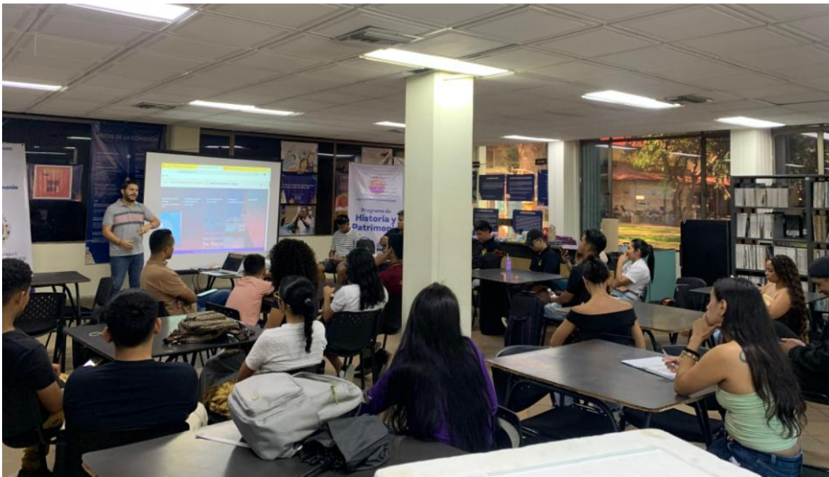
Taller sobre el Fondo Documental de la Comisión de la Verdad, realizado en el marco del proyecto con el Archivo General de la Nación (AGN).