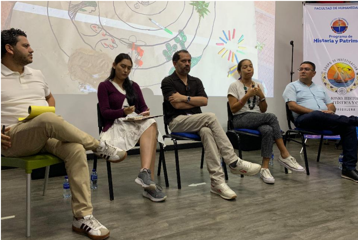
Conversatorio sobre memoria, verdad y territorio, realizado en el marco del proyecto con el Archivo General de la Nación (AGN).