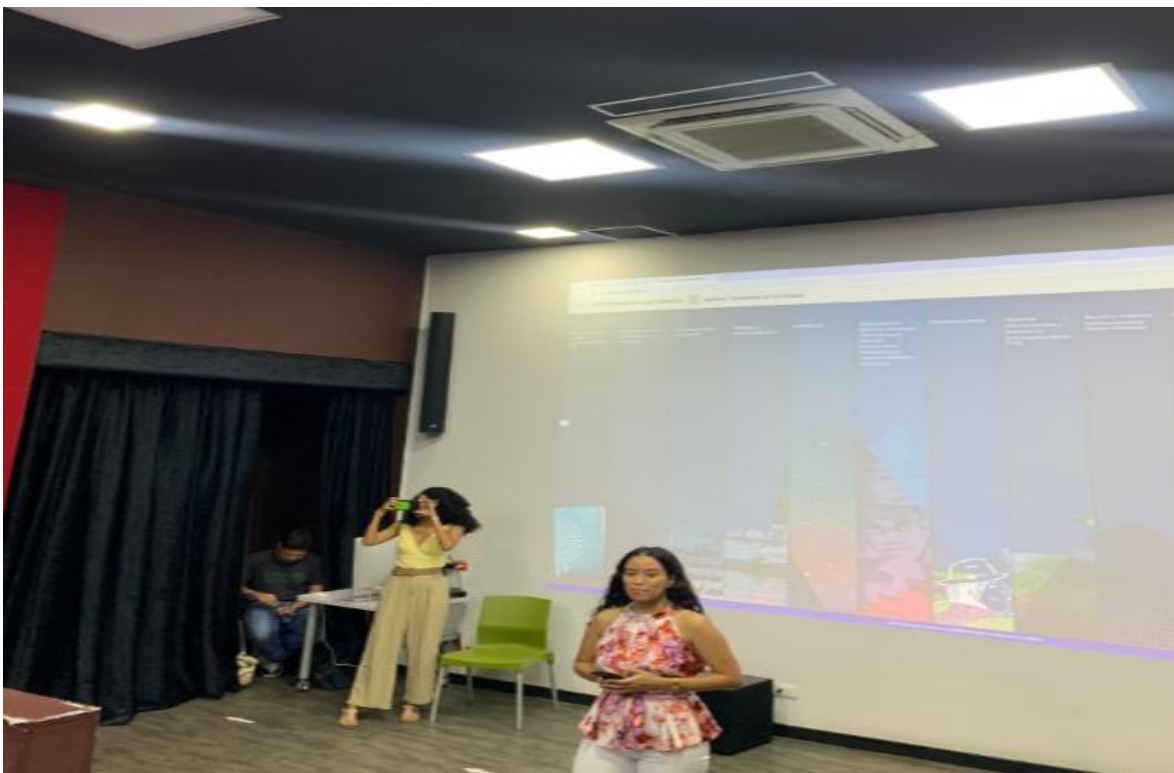
Cine Club Memorias e Imágenes de la Verdad: proyección Develaciones: Un canto a los cuatro vientos.