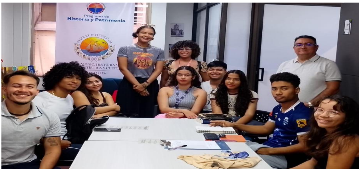
Conferencia “Tratados y acuerdos comerciales de navegación y límites en la Amazonía (1851–1903)”, espacio de reflexión histórica.