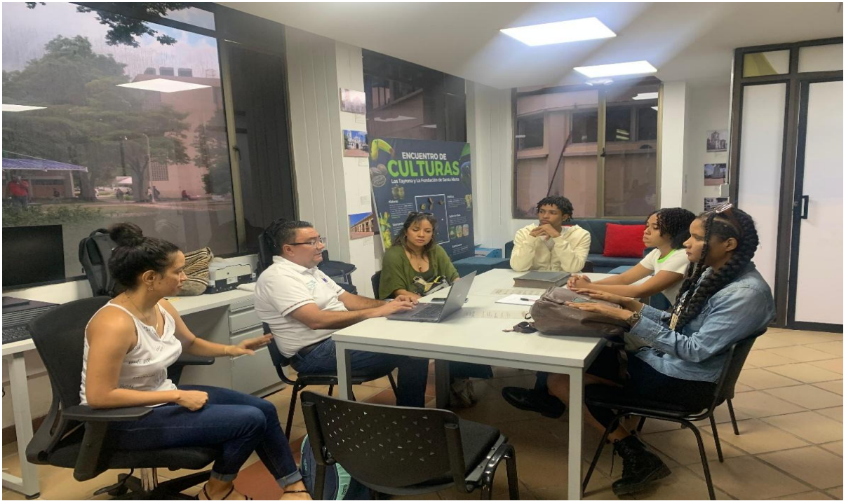
Reunión de trabajo con ayudantes de investigación del Laboratorio de Historia y Patrimonio.