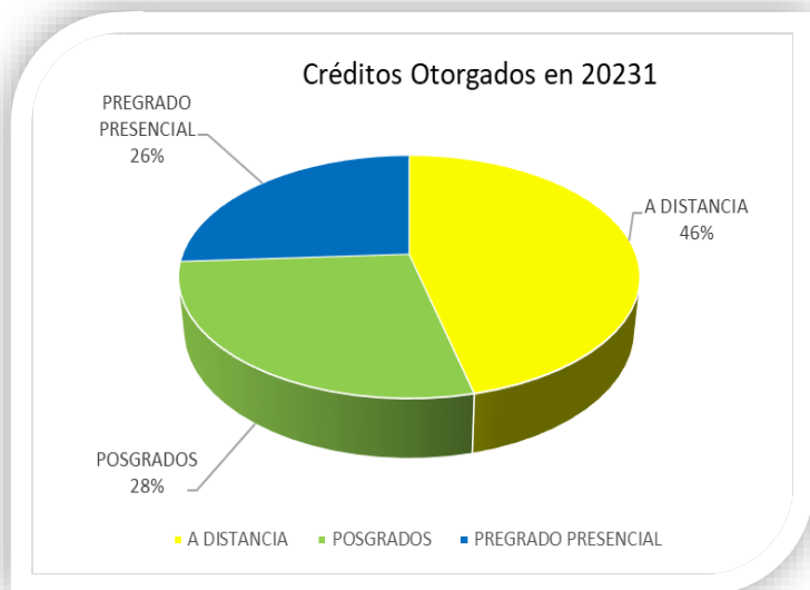
Gráfica 2: Créditos otorgados en 20231 por modalidad.